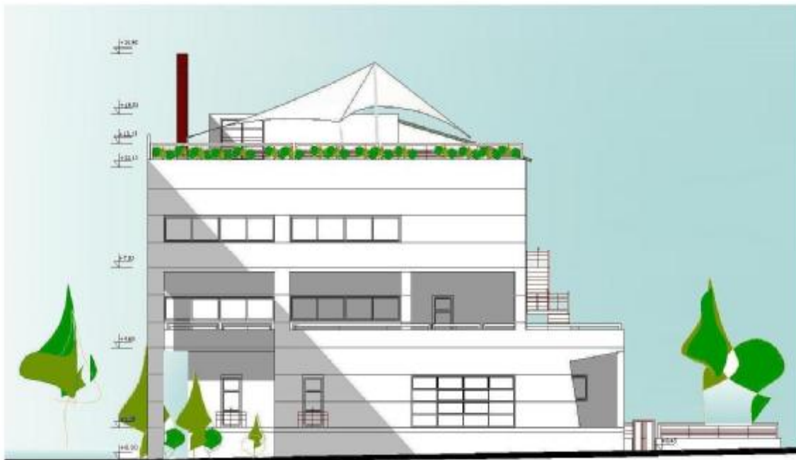
ΝΟΤΙΟΑΝΑΤΟΛΙΚΗ ΟΨΗ (από οδό Ηρώων Πολυτεχνείου)

Ο προϋπολογισμός της μελέτης είναι 2.045.000 € και η χρηματοδότηση του πραγματοποιείται μέσω του προγράμματος « ΘΗΣΕΑΣ». Την Επίβλεψη του έργου έχει η Διεύθυνση Τεχνικών Υπηρεσιών Δήμου Λαρισαίων.